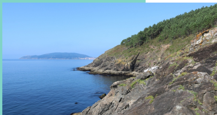
15-Punta do Salto