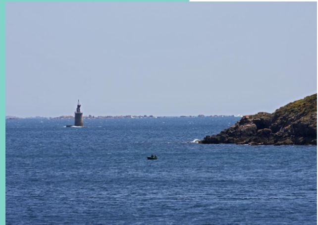
11-Carrumeiros Grande e Pequeno