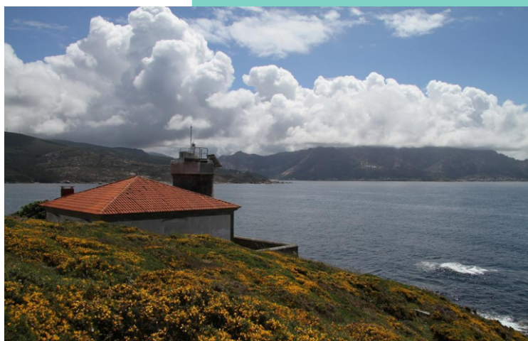
Faro do cabo de Cee, edificado no 1860.