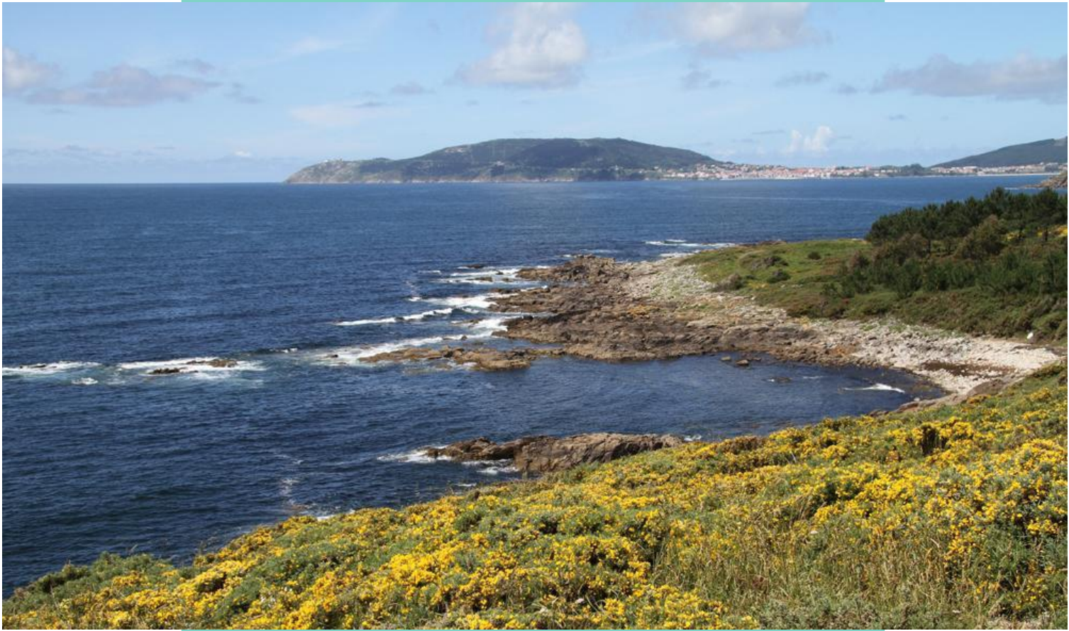
Vista desde o cabo de Cee cara a Fisterra