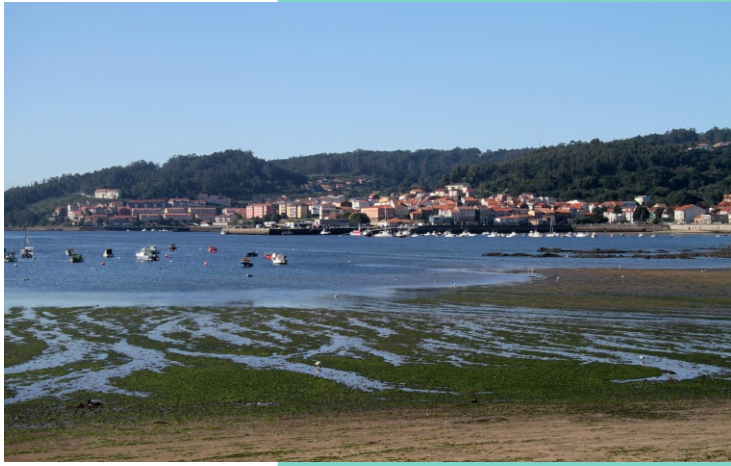
Corcubión. Praia de Santa Isabel, vila e porto.