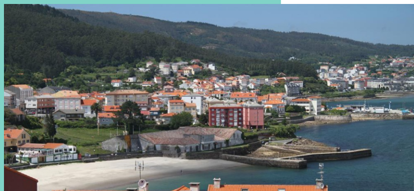
3-Praia e punta de Quenxe