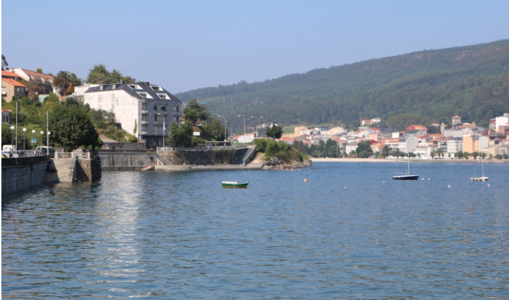
1-Punta do Pino

Situada no fondo da gran enseada que se forma entre o cabo Fisterra e o Monte Pindo. Ábrese entre o Cabo de Cee e a punta Galeira. No fondo están situadas as vilas de Corcubión e Cee.