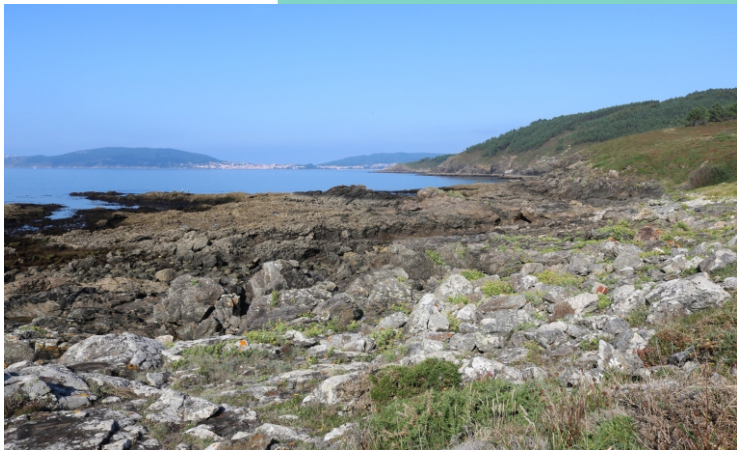
13-Posta de Herba