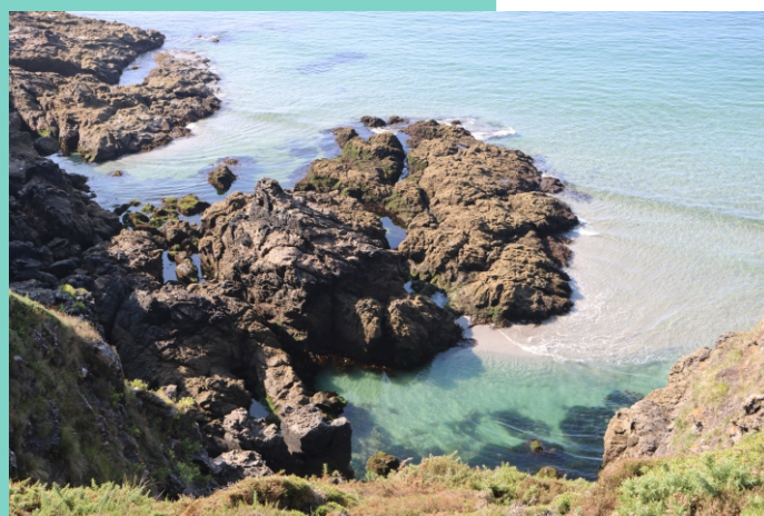
14-Punta Liñeiro e praia da Coviña