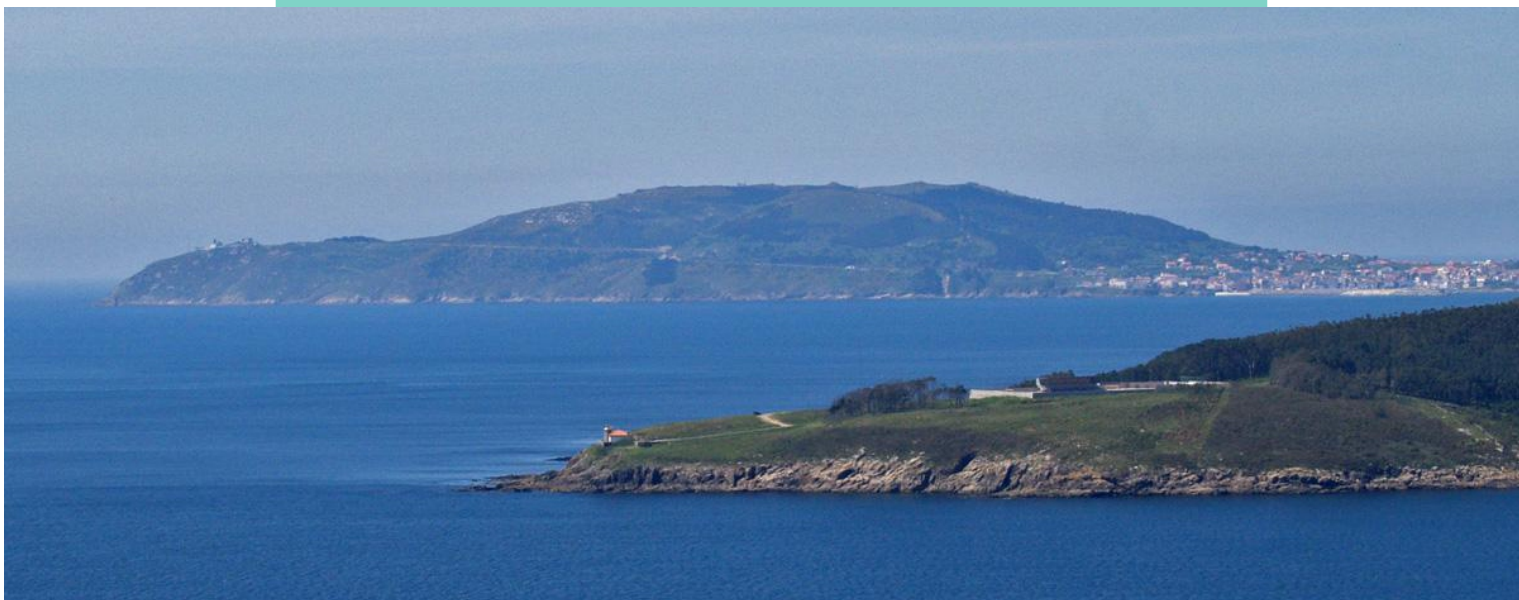
Cabo de Cee