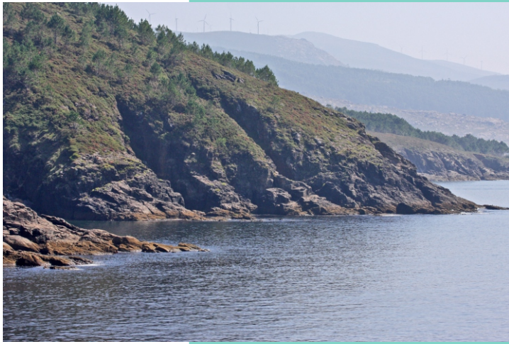
Punta do Salto