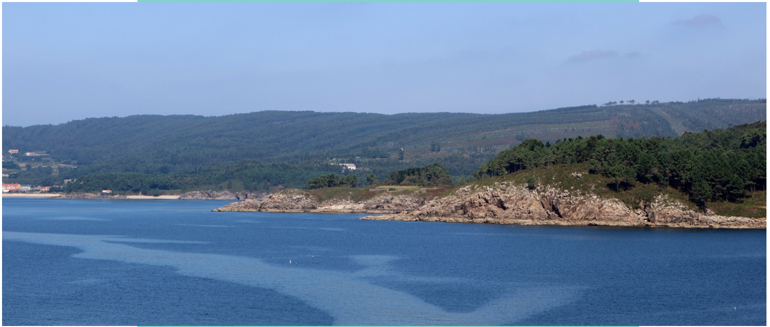
Puntas Marxenta e do Corno