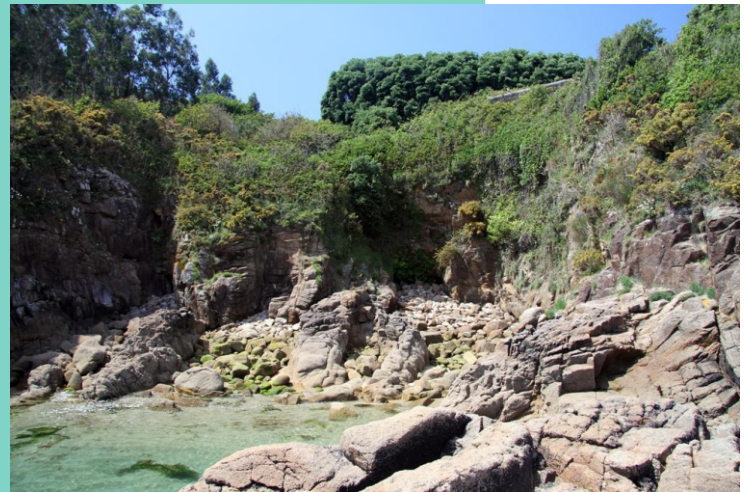
4-Punta do Cabalo. Castelo do Cardeal.