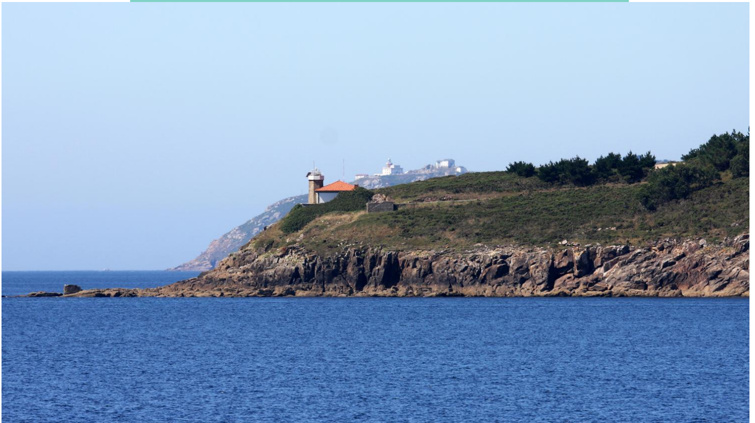
10-Cabo de Cee. Detrás vese o cabo de Fisterra.