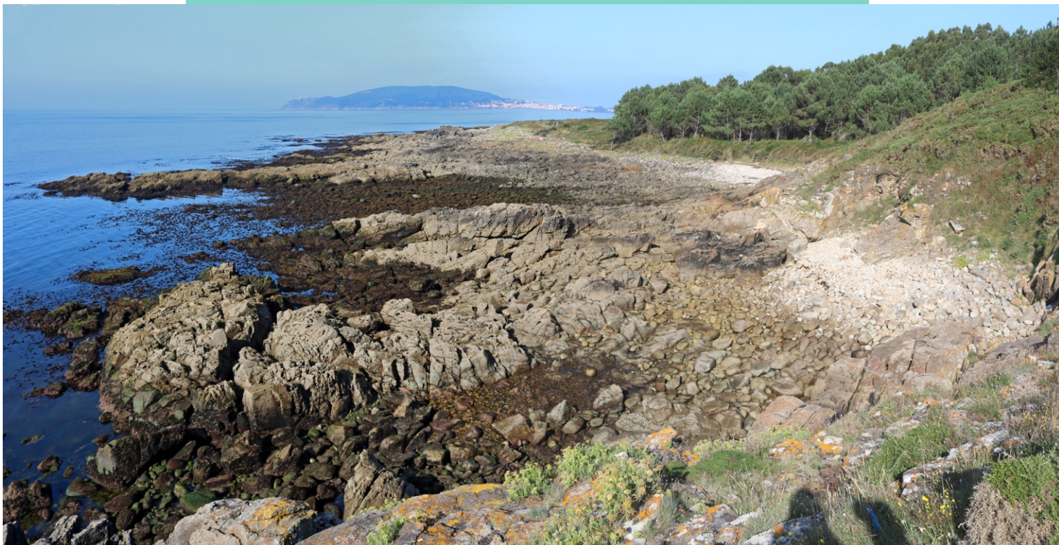
Boleiras no cabo de Cee .