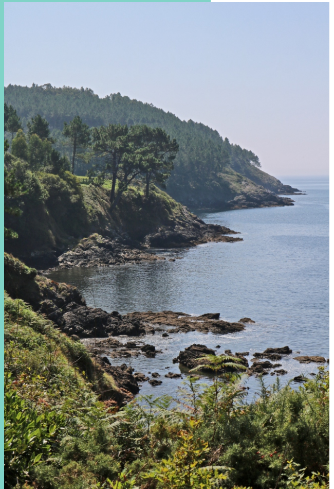
Vista desde punta Pía ata o cabo da Nasa