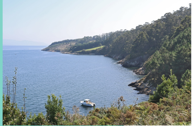
Vista desde o castelo do Cardeal cara ao cabo de Cee. Punta das Mariñas, punta do Seixo e Boca do Sapo.