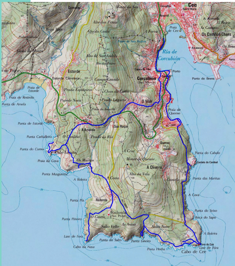
Percorrido a pé

O percorrido en coche limitase a catro paradas: na vila, no faro, na Redonda e na Amarela; e varias camiñadas, uns 10 km en coche e outros tantos a pé, para percorrer a vila, para achegarse desde a Redonda ao cabo da Nasa e