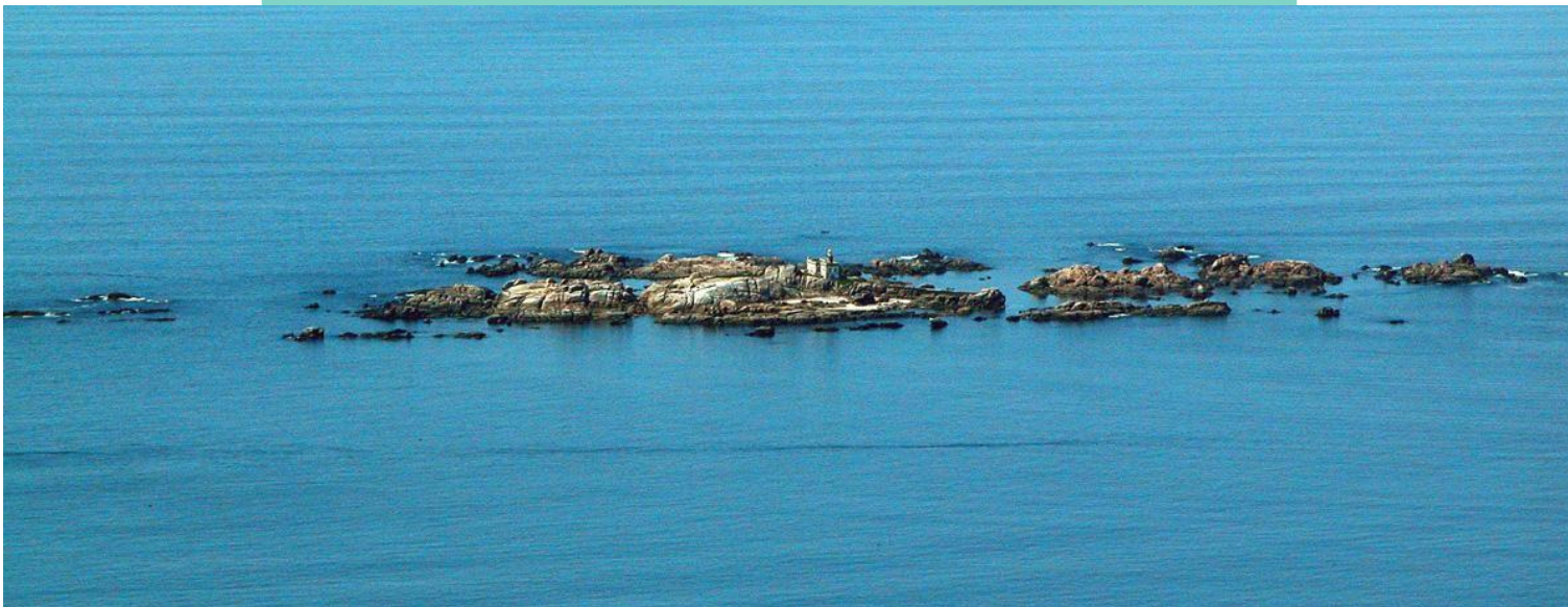
12-Illas lobeiras. Pequenos illotes rochosos que forman parte do espazo protexido "Carnota Pindo". Son un importante lugar de cría de aves e conservan unha interesante flora e fauna mariñas.