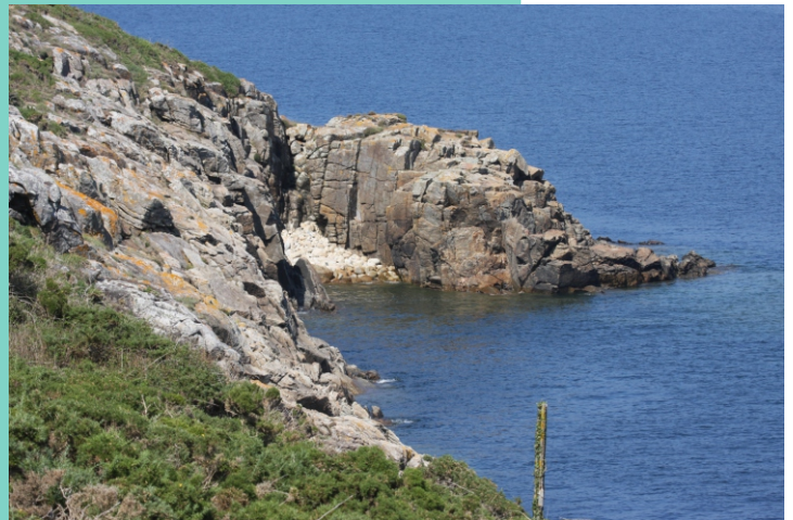
A Boleira desde o Cabo de Cee